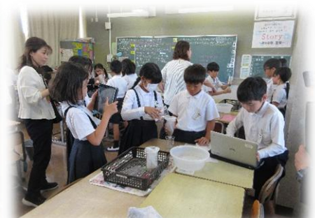
4年1組「雨水の行方と土地の変化」