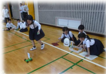
3年2組「風とゴムの力の働き」