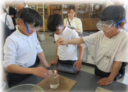
6年2組「燃焼の仕組み」