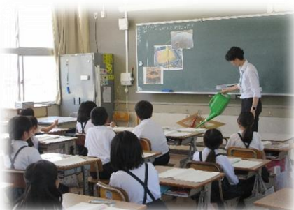
4年2組「雨水の行方と土地の変化」