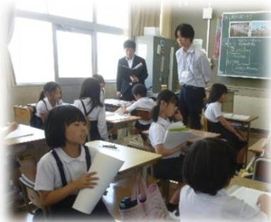
3年1組「風とゴムの力の働き」

授業後には、指導主事の先生方から多くのご助言をいただきました。11月には本校で、広島県の理科教育研究大会も予定されています。今回の学びを今後の授業づくりに生かしながら、子どもたちの「考える力」や「表現する力」などの資質・能力の育成に、引き続き取り組んでいきます。