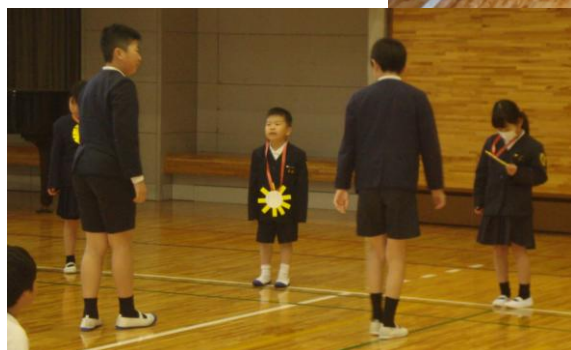
プレゼント 嬉しかったね😊