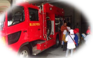
福山地方卸売市場 東消防署