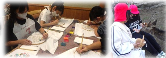
大阪 奈良 京都