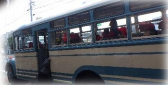
福山市立動物園 福山自動車時計博物館