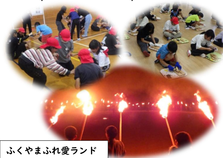
ふくやまふれ愛ランド