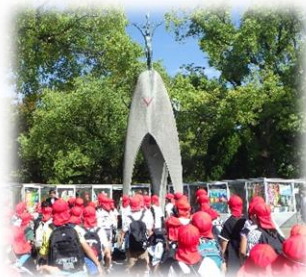
平和記念公園 広島平和記念資料館