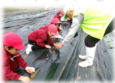
野菜作り体験（2年生）