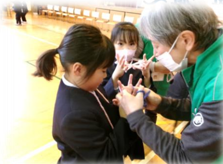
昔の遊びの伝承（1年生）