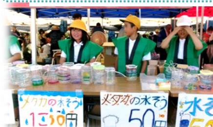
メダカの学校・メダカ祭り（4年生）