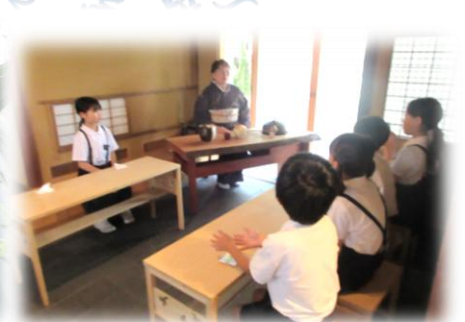
信岡フラットミュージアムからの学び（3年生）