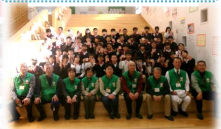
民生ジュニアの活動（5年生）