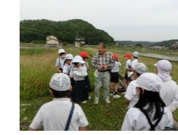
＜ナゴヤダルマガエル＞