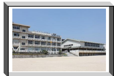
福山市立済美中学校