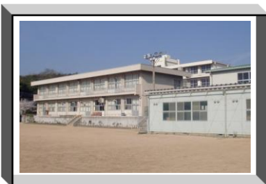
福山市立津之郷小学校