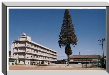
福山市立赤坂小学校