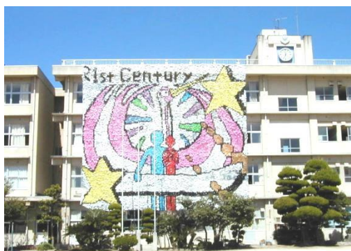
福山市立幸千中学校