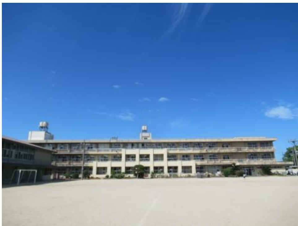
福山市立御幸小学校