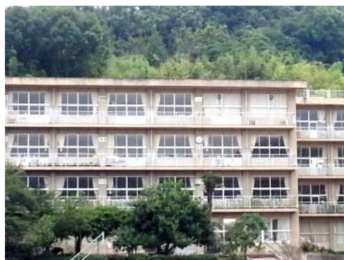
福山市立千田小学校