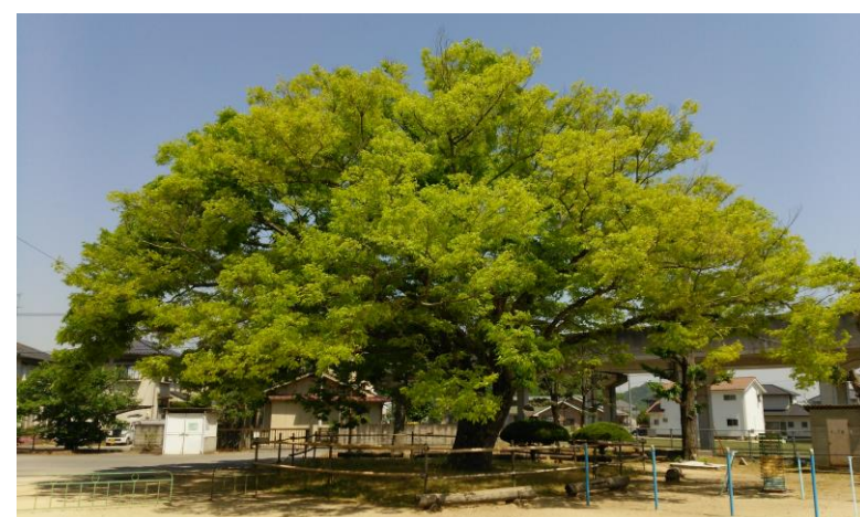
御野小学校のシンボル、樹齢 140 年以上の榎（けやき）