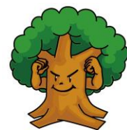
御野学区キャラクター 「ケヤッキー」（児童デザイン） 「もも姫」（職員デザイン）