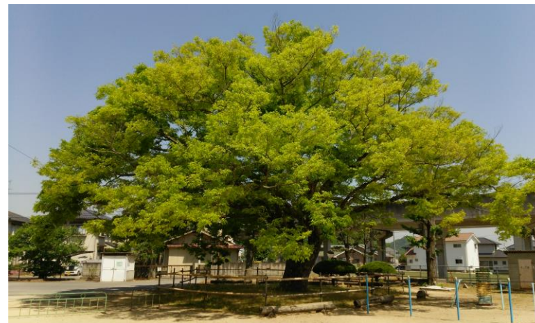
御野小学校のシンボル、樹齢140年以上の榎（けやき）