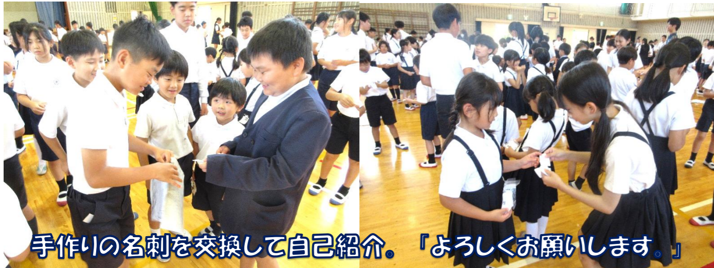
手作りの名刺を交換して自己紹介。「よろしくお願いします。」

前期はげみ議会は、「思いやりのある優しい学校」にするために、ローズマインドを合言葉に活動しています。先日の「みのっ子集会」では、はげみ議会のリードで「思いやり・優しさ・助け合い。合言葉は、ローズマインド!」を全校で唱えてゲームをスタートしました。縦割り班の班長さんを中心にして、「名刺交換大会」や「一致団結の樹(新聞ジャンケン)」などのゲームでふれ合いながら、体育館が笑顔と歓声でいっぱいになりました。御野小の全校児童がさらに仲良くなれたようです。