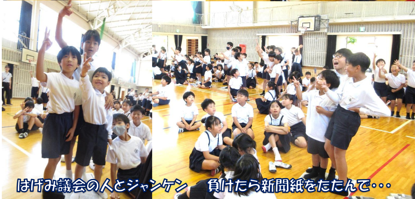
はげみ議会の人とジャンケン 負けたら新聞紙をたたんで...