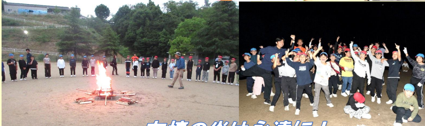
友情の炎は永遠に！