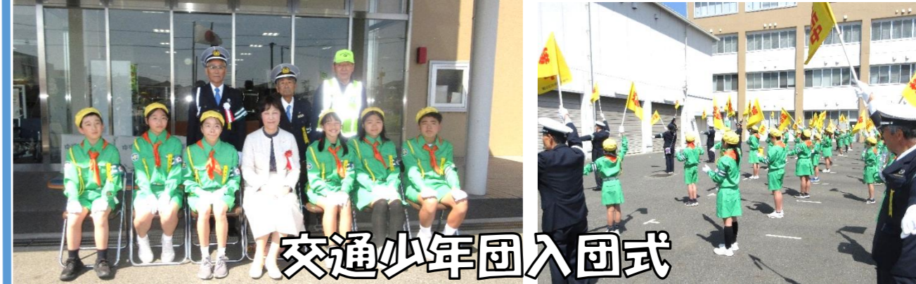
交通少年団入団式

いよいよ、本年度も交通少年団の活動が始まりました。交通少年団のみなさんは、「御野小学校のみんなの安全を守りたい。」と自ら進んで、この交通少年団の活動に挑戦してくれました。4月15日(水)から登校指導で交通安全活動がスタートしました。