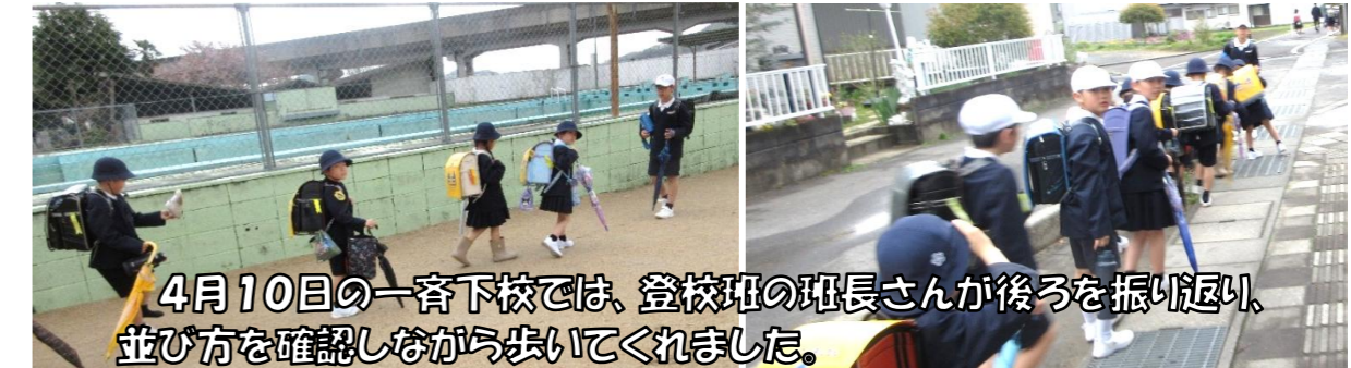
4月10日の一斉下校では、登校班の班長さんが後ろを振り返り、並び方を確認しながら歩いてくれました。

学校でも交通ルールやマナーを守ることに指導していますが、保護者の皆様、けやきっ子サポーターの皆様には、引き続きご指導をよろしくお願いいたします。