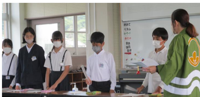
〔手ぬぐいのたたみ方を教わっている〕