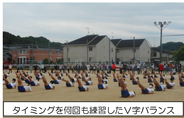
タイミングを何回も練習したV字バランス