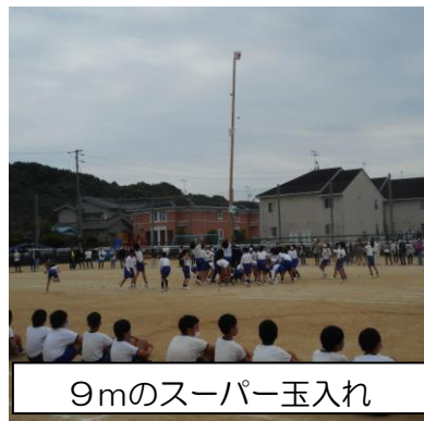
9mのスーパー玉入れ