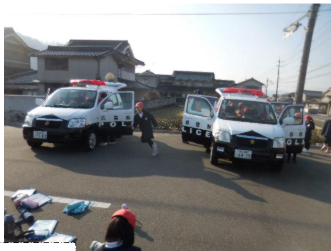
見学をした後のふりかえりです

けいさつの人は持ち物を たくさん持って、ぼうだん チョッキなど重いものを着 てげん場にかけてつけるから すごきたいへんだというこ とが分かりました。