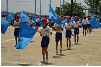
5・6年生「意旗揚々」かっこよく表現しました。