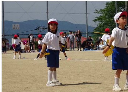
1・2年生「ダンス王に、みんなでなる☆」笑顔で元気に踊りました。