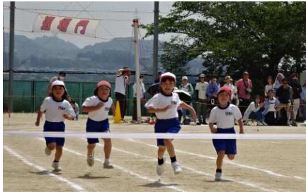
2年生「ゴールを目指して」全力で走り切りました。