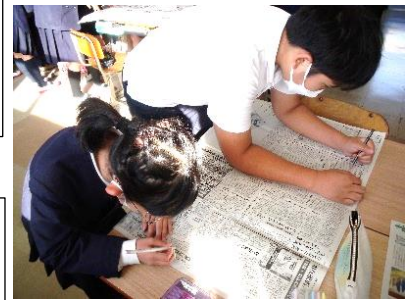
一年生とのフレンドリー