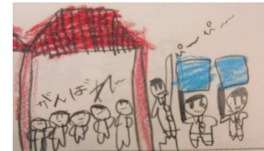
イラスト (まさき れおん)