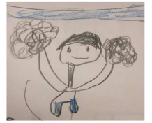
イラスト (はら そうし)