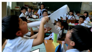
きょうりゅうをつかったよ。