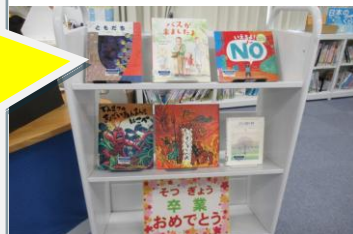
当日のラインナップ