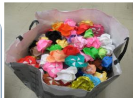
全校児童分のバラ

先日、折り紙の大好きな6年生の女子が「これ、全校のみんなに渡してほしい」と持参してくれたのは、折りバラ。その数、何と300個ほど。聞くと5年生後半から折っていたというではありませんか。1個作るのも時間がかかる折りバラ。その児童は「感謝の気持ちを折りバラに」込めたのでしたが、いやいや、その思いに感謝です。