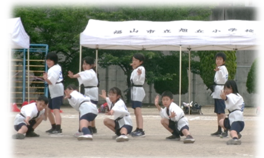
ビシッときめた3・4年生！