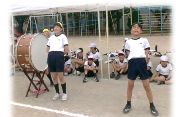
「自ら考え、行動する」その姿が次の学年に引き継がれる！