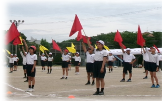
動きで魅せた5・6年生！