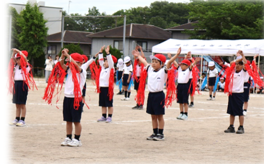
元気いっぱい1・2年生！