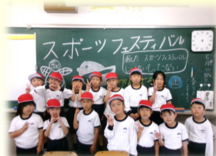
6年生から届いた黑板メッセージを受け取り、やる気もUP！

6年生が、下級生に向けて黑板いっぱいメッセージを書いてくれました。当日の朝、はりきってやってきた子ども達ですが、メッセージを読んで更に意欲が高まったようです。また、5・6年生は、本番に向けてエールを交換していました。学校を支える高学年の素晴らしい姿です。