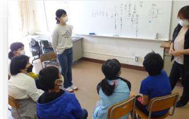
前日準備(4/5)の6年生の様子

今の時代は、多くの新しい技術が生まれる反面、先が見通せない時代です。だからこそ、「今までなかったものを生み出す力」言うなれば「イノベーションを起こす力」というものが求められています。今年もたくさんの「イノベーション」が生まれる、そんなワクワクするような1年にしたいと思います。