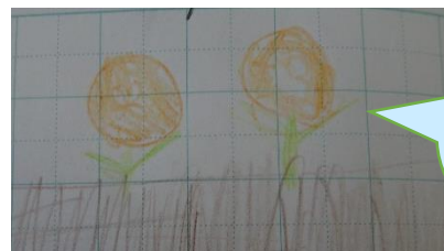
ついに…待ち望んでいた気持ちが伝わります！

9月16日にタネをうえて9月18日にめがでて12月3日につぼみがでて12月16日についにマリーゴールドがさきました！