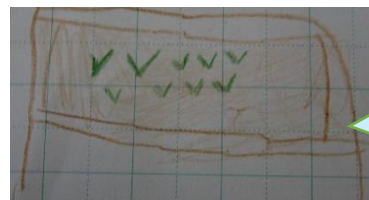
いつもかわいいイラストがかいてあります！

9月16日にタネをうえて18日にはもう小さいめがでていました。こんなにはやくでるとはおもわなかったです。