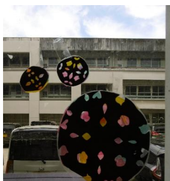
2年 上おかこころさん すきとおるフィルム