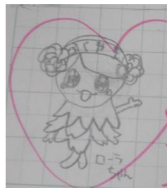
ローラちゃん みやぐちせなさん作

福山市はせんそう中空しゅうで町のたくさんのばしよをうしなしました。戦争がおわってあれはてた町にきぼうをあたえ、人々の心にやすらぎをとりもどそうとこうえんにばらが植えられました。ばらまつりには へいわへのねがい がこめられています。