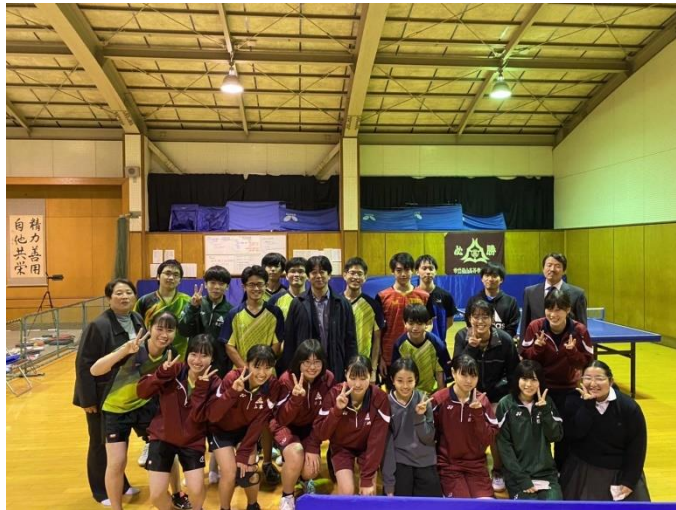
最後に全員で記念撮影