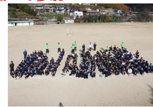
【地域貢献/ボランティア】