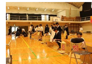
【地域貢献/防災減災DAY】