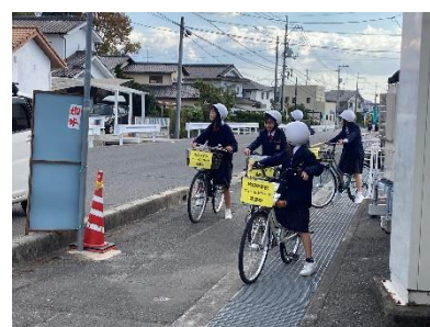
〔地域学習 フィールドワーク〕