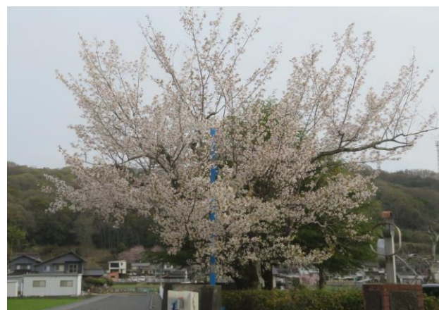
神辺東中学校の桜