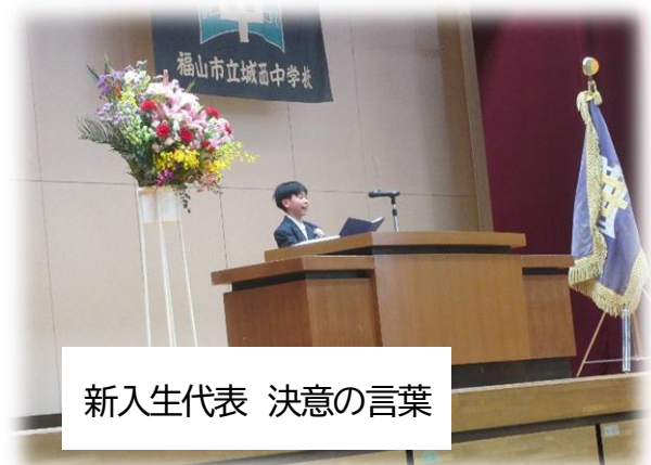
新入生代表 決意の言葉

第46回入学式を挙行了ました。学校行事実行委員会を中心として、「出会いを大切に」を合言葉にして準備を進めてきました。