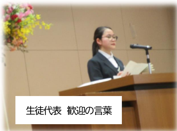
生徒代表 歓迎の言葉