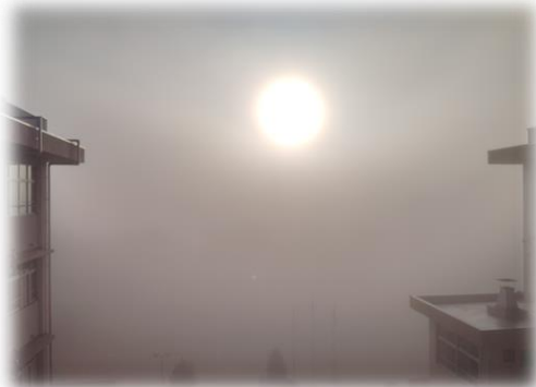
4階 渡りろう下からの様子