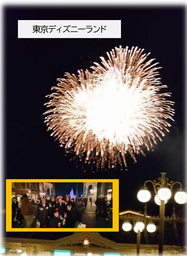
東京ディズニーランド