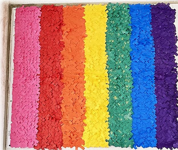
1・2年生の靴箱の前に掲示しています。