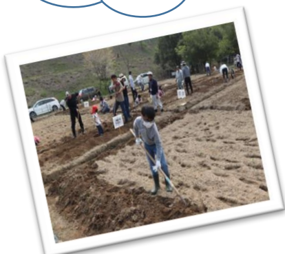
みんなで協力、畝作り