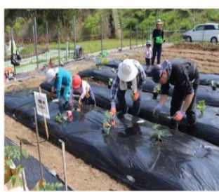
植付け完了 収穫が楽しみ♪