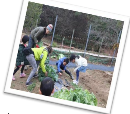
大きく育った野菜を収穫!