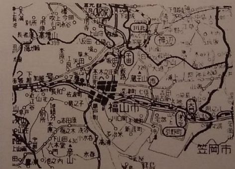
空襲を避けて広島県へ疎開(○印は疎開地)