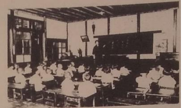
1年生はかたかな先習