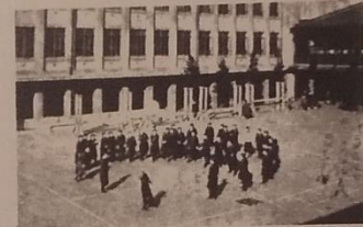
併設の神子田女学校の生徒