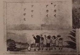
第5期国定教科書(アサヒ読本)