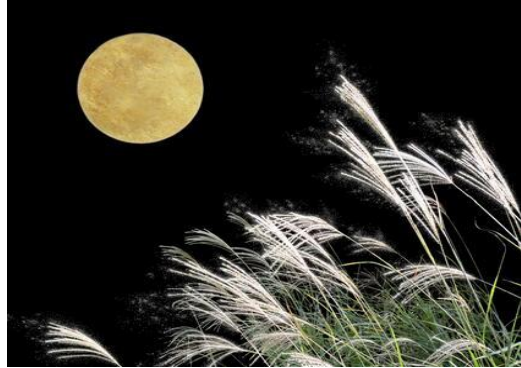
*今年の中秋の名月は9月29日(金)です。

これから、季節は彩られ、爽やかな秋を迎えます。体も心も実り多き、充実した2学期にしたいですね。