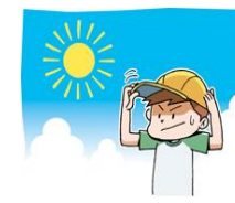
外に出るときは帽子をかぶる