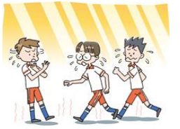
無理は禁物。声かけ合って！

新型コロナウイルスの影響で、心音・心電図検査(1年)、歯科検診、耳鼻科検診、眼科検診、内科検診が延期になっていましたが、9月から感染防止対策をしながら実施する予定です。ただし、感染の流行状況によっては、実施できない場合もあります。