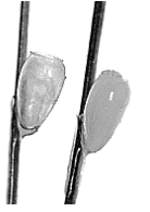
アタマジラミの卵