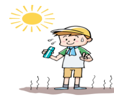
しっかり水分補給

暑さで息苦しいと感じた時などには、マスクを外したり、一時的に片耳だけかけて呼吸したりするなどしましょう。その際、5分間の会話は1回の咳と同じなので、会話は控えましょう。