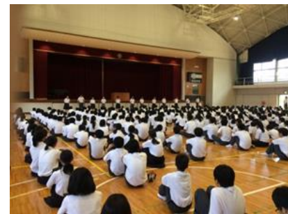
【校区あたりまえ3項目 (時間を守る)】