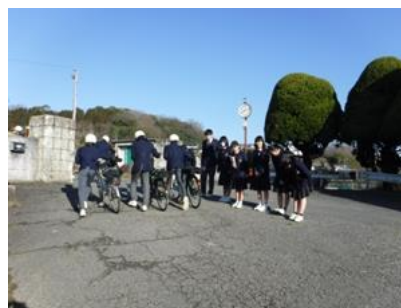
【校区あたりまえ3項目 (あいさつ)】