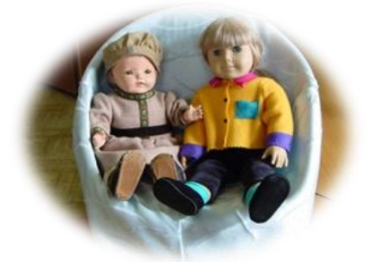
日米親善の象徴 アメリカ人形 メアリーちゃんとナターシャちゃん