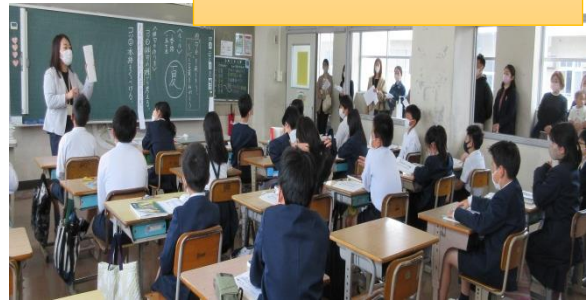
国語「句会を楽しもう」