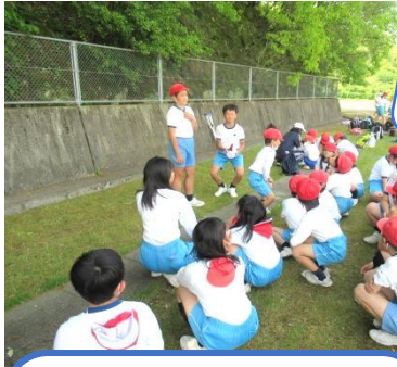
2年生に遊びの説明