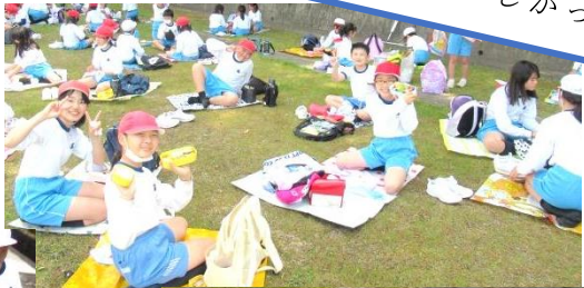
お弁当おいしかった～！！

自分以外のこと（プラス1）も気を配ってくれた5年生がたくさんいてびっくり！！ 5年生のみんなありがとう！！