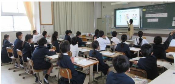
英語「好きな物をたずねたり答えたりする言い方を知ろう」

参観日後には、懇談会にもご参加いただきありがとうございました。懇談会では、5年生になって高学年として頑張っている子どもたちの様子や、忘れ物をなくすように取り組んでいる様子などを交流しました。ゴールデンウィーク明けから、野外活動に向けて動き出します。様々なことに挑戦し、お互いを高め合いながら成長して行ってほしいと思います。