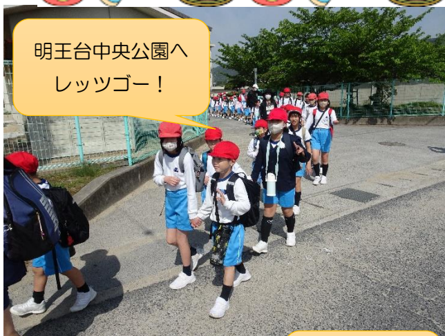
明王台中央公園へ レッツゴー！