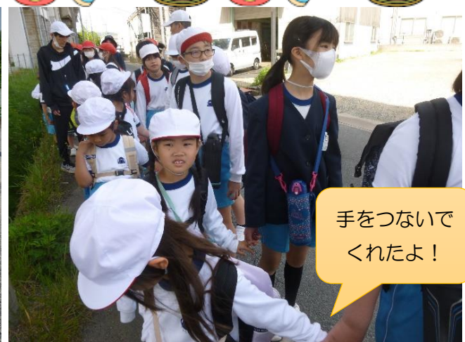
手をつないで くれたよ！