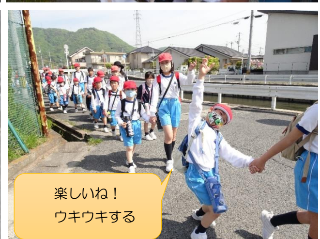
楽しいね！ ウキウキする