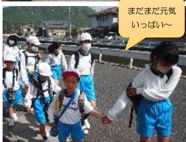
まだまだ元気 いっぱい～