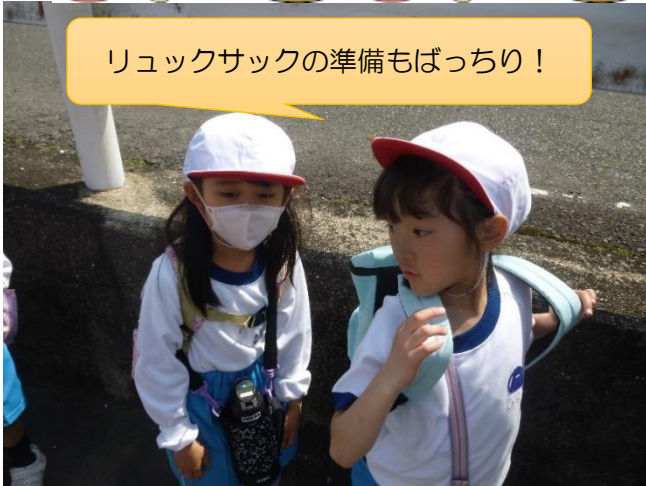
リュックサックの準備もばっちり！