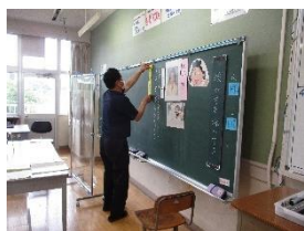
2年生「絵がすき海がすき」

6月11日(金)は道徳参観日の予定でしたが、緊急事態宣言発令中ということで、 運動会同様、クロムブック(一人一台端末)を活用して授業の様子をご家庭にお伝えしま した。資料と自分の生活を結び付けて考えながら、自分はどのようにしていきたいか、深 く考えることができました。