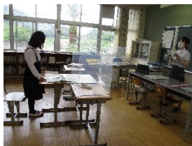
6年生「マザーテレサ」