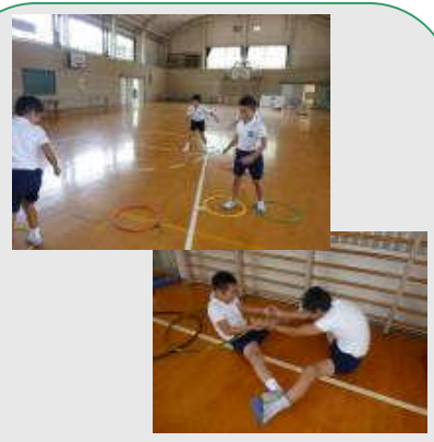
大休憩前のトレーニングタイム