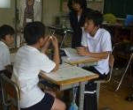
新体カテストを分析、自己課題の把握