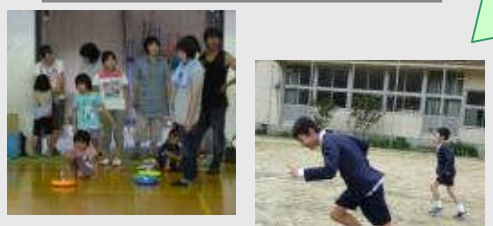
外遊びの推進 地域行事・水泳・陸上記録会への参加