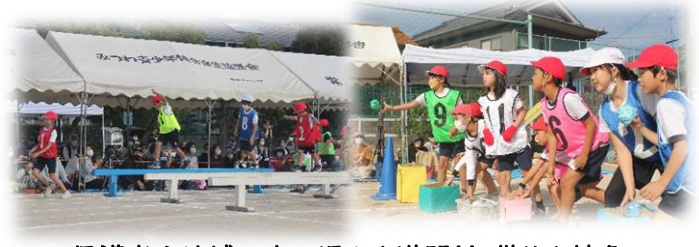
保護者や地域の方の温かさ満開!! 借り人競争