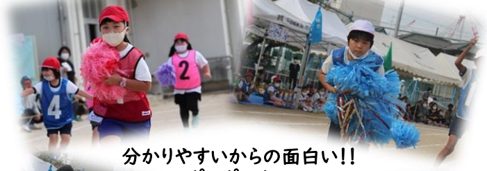
分かりやすいからの面白い!! ポンポンリレー