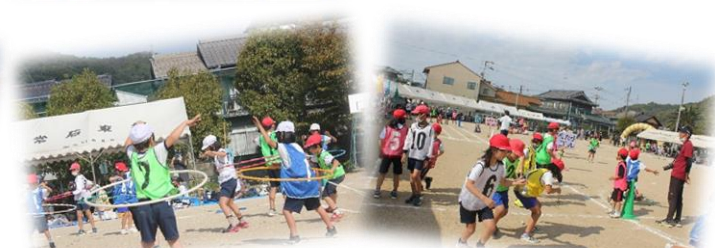
試行錯誤の末の大作!! 人間すごろく