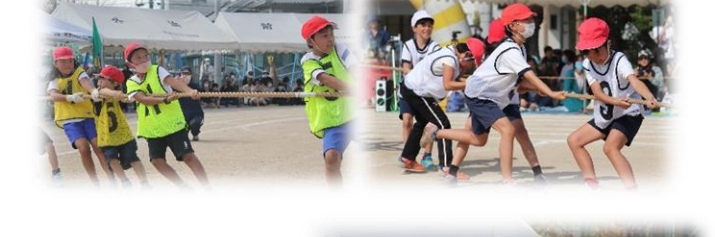
みんなでもにつくる運動会になりました!