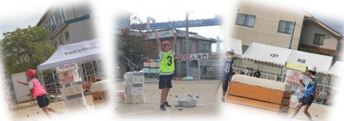
BGMにもこだわりが満載!! 戦国玉合戦