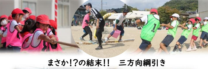
まさか!?!の結末!! 三方向綱引き