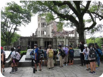
4・5年生 社会見学 平和の願いを込め、公園を巡りました