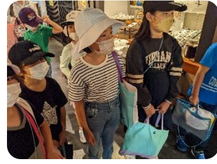
勉強堂でも、お米が使われていました