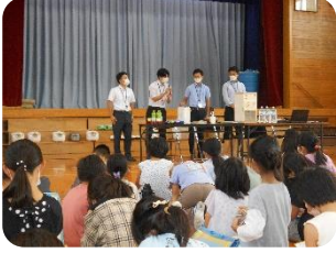
食協の方にも来ていただきました