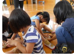
もみ殻を取るって、大変!