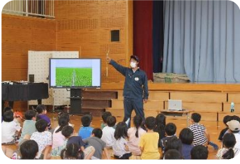
低学年WO「お米プロジェクト」 オコメレンジャー、参上!