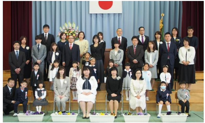
ふね組 | 年生