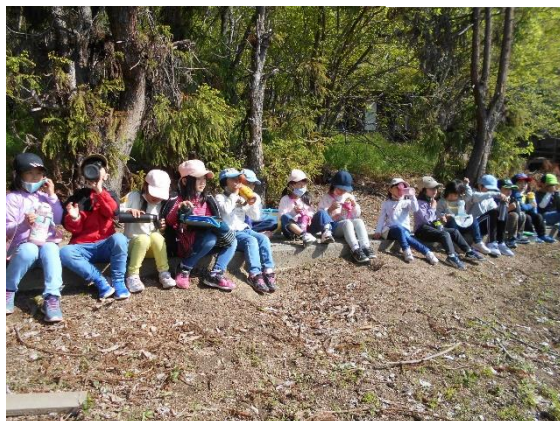
春をみつけに山へ行こう！