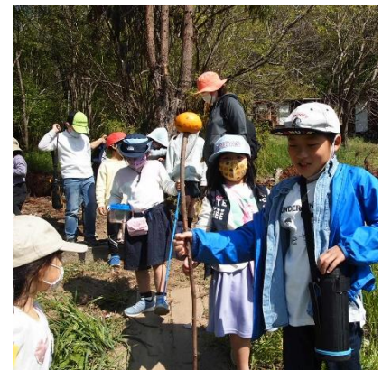
なにが見つけたの？