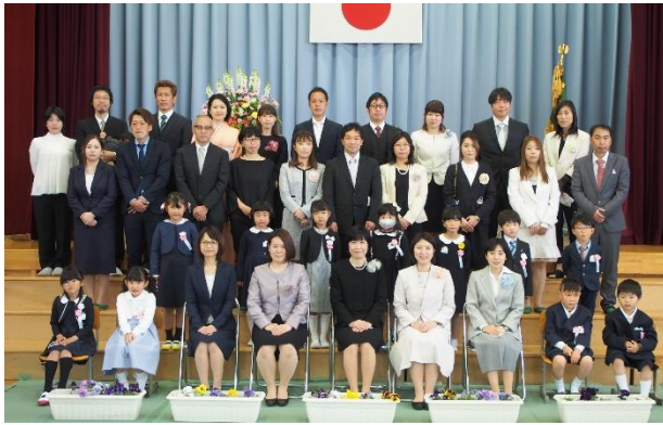
たまご組 | 年生