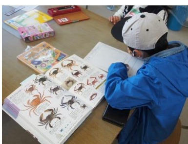
作るぞ、自分だけの図鑑