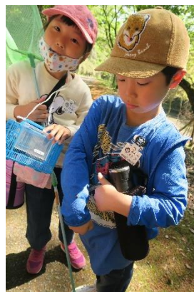
どんな生き物がいるかな？