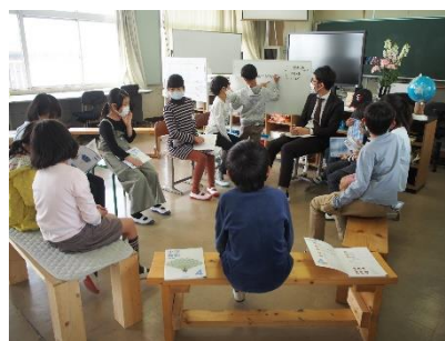
サークルで意見交流