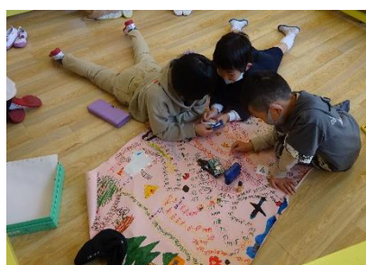
すごいすごろくができたよ！