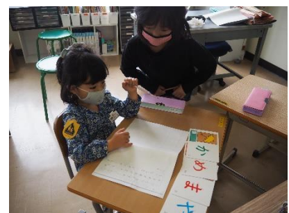
お姉さんが教えてあげようか？