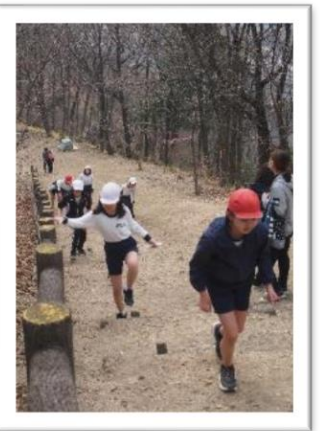
通称「地獄坂」キツイ！