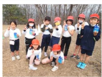
それぞれのグループのトップでゴール！