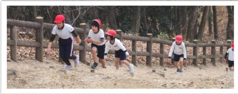
最後まで走りぬくぞ！