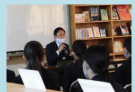
薬物乱用・喫煙防止教室・SNS防犯教室