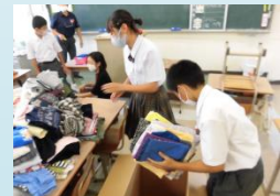
SDGs “服のチカラ プロジェクト”