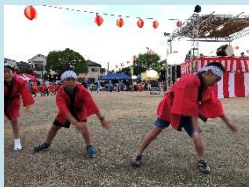
夏祭り小学生ソーラン隊