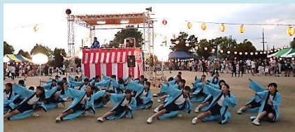
夏祭り中学生ソーラン隊