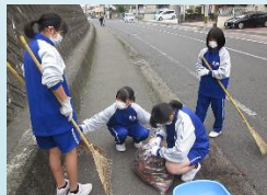
地域ボランティア