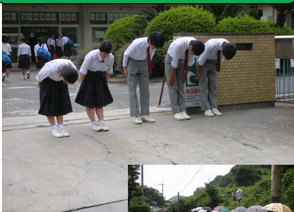
地域の人たちも参加してあいさつ運動