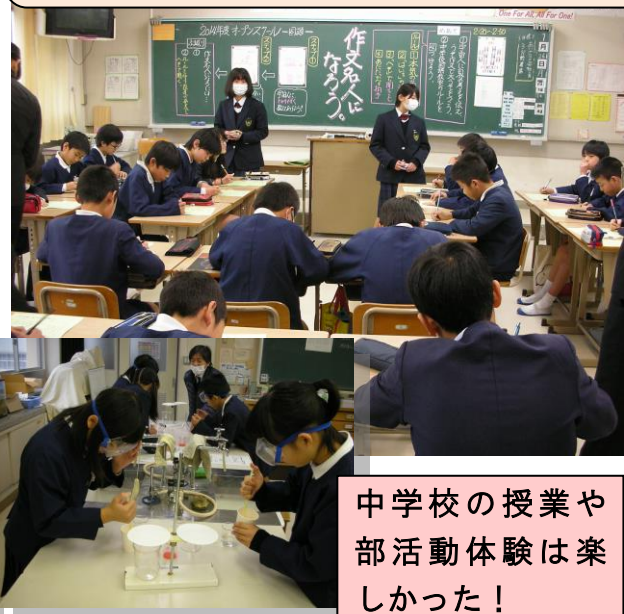
中学校の授業や部活動体験は楽しかった!