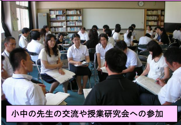
小中の先生の交流や授業研究会への参加