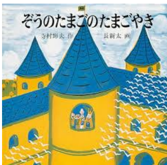
ぞうのたまごのたまごやき 作：寺村 輝夫