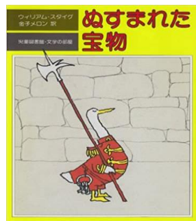
ぬすまれた宝物 作：ウィリアム・スタイグ