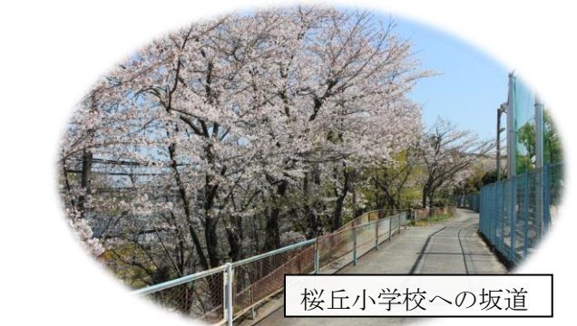
桜丘小学校への坂道