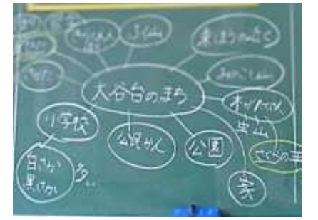
【3年 総合 大谷台にあるものは？】