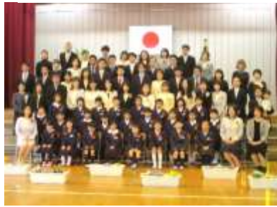
【入学式後の記念写真撮影】