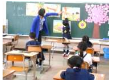
【1年 生活 春見つけ】